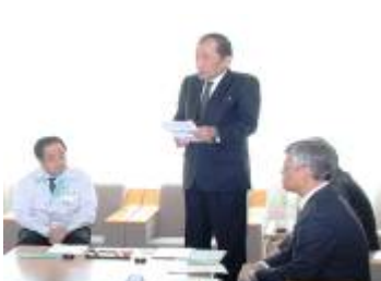
久留嶋社長からの挨拶