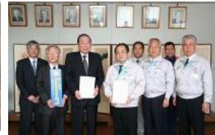
全員での記念撮影