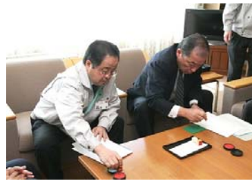
2通の協定書にお互い調印