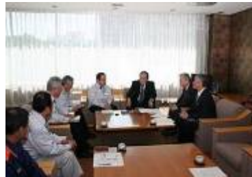
協定式後の意見交換